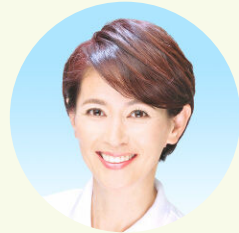
スペシャルアンバサダー 有森 裕子 さん (岡山県出身)