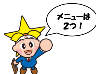
岡山県マスコット「ももっち」