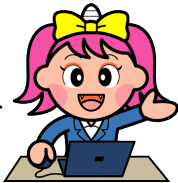
岡山県マスコット「うらっち」