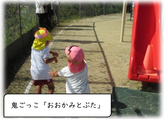
鬼ごっこ「おおかみとぶた」