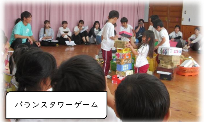
バランスタワーゲーム