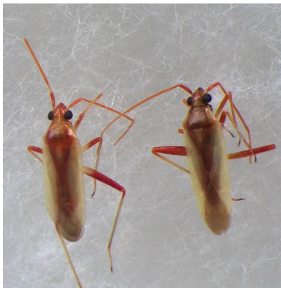
アカスジカスミカメ成虫（体長約 5 mm）