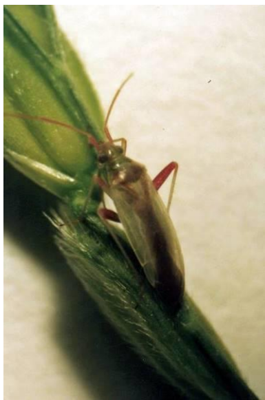
アカスジカスミカメ成虫 (体長約5mm)