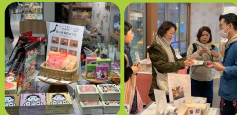
昨年度事業イベントの様子