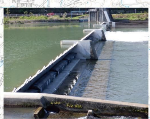
農業用河川作物応急対策事業(笠ヶ瀬地区)