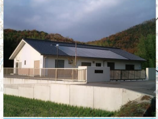
農業集落排水事業(新庄地区)