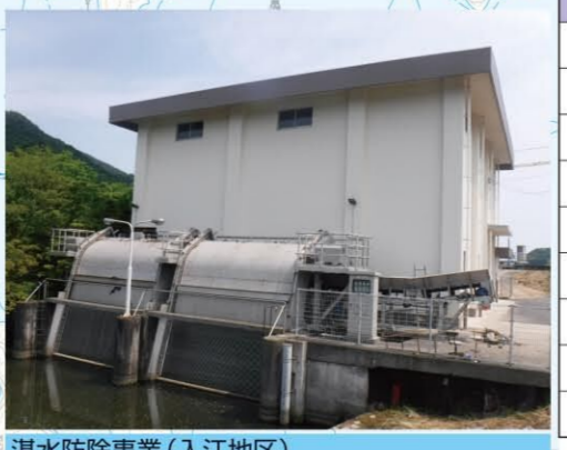
潜水防除事業(入江地区)