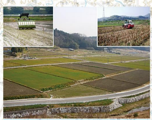
経営体育成基盤整備事業(高部地区)