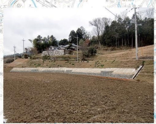
地すべり対策事業(津山市東部地区)