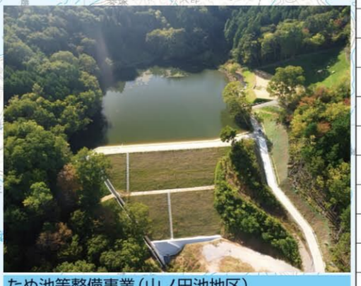
ため池等整備事業(山ノ田池地区)