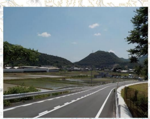
広域営農団地農道整備事業(備前東部地区)