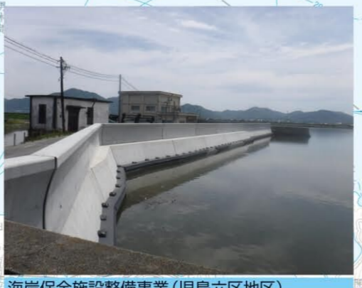
海岸保全施設整備事業(児島六区地区)