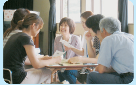
玉野市立和田幼稚園すくすくサロン

小学校入学時に「自分のことは自分でできる」という自信をもつことができるように、関わり方のポイントについて考えることができる。