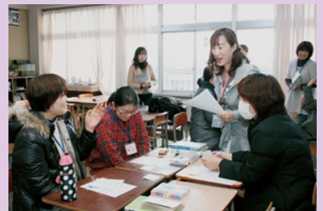
●岡山市立津島小学校学級懇談●

この研修を通して、いろいろな考えにふれられてよかったです。他の人から参考になる話をたくさん聞けたので、自分でも実行することができればいいなあと思います。