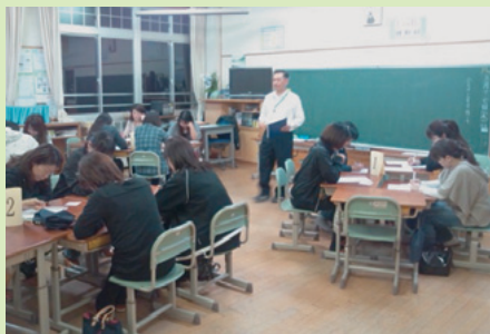
●真庭市立米来小学校 PTA 研修会●