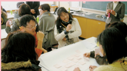
●浅口市鴨方町連合 PTA 交流会●

意外に皆さんも同じことを悩んでいるんだということが分かりました。他の人に共感してもらえて、毎日の子育てをがんばれるような気がします。