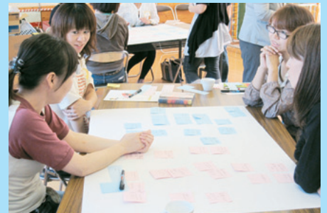
●総社市立池田幼稚園 PTA 研修会●