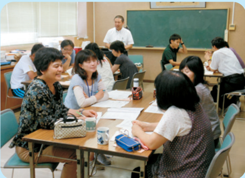
美咲町立柵原西小学校校内研修