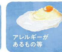
アレルギーがあるもの等