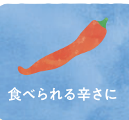
食べられる辛さに

セットメニュー等の中に、食べられないものが入っていたら注文時に抜いてもらえるかどうかあらかじめ確認してみましょう。