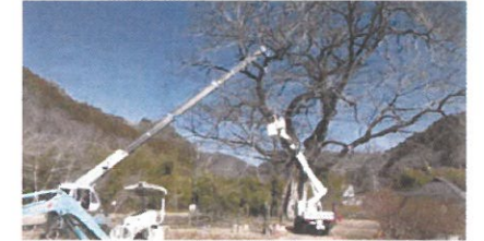
巨樹・老樹・名木の保存(美作市 横川のムクノキ)