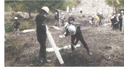
子供たちによる植樹(津山市 加茂小)