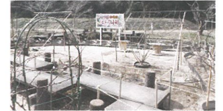
市民団体による公園整備(井原市)