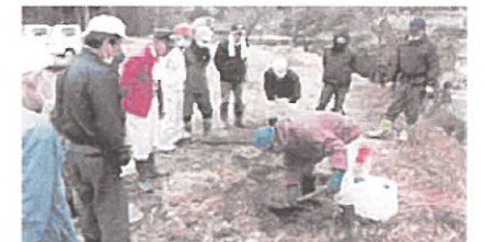
公園・学校など公共施設の緑化(美作市)