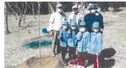
公園・学校など公共施設の緑化(備前市)