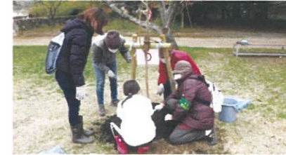
市民による公園の緑化(倉敷市津津公園)