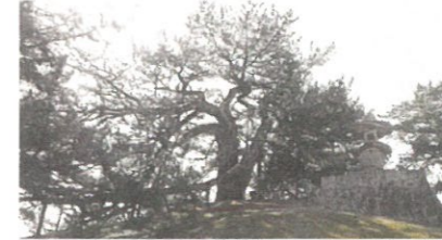
巨樹・老樹・名木の保存(総社市 角力取山の犬松)