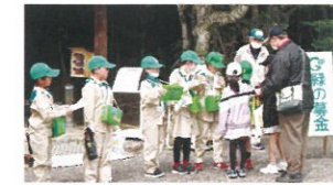
みどりの少年隊による募金活動

緑の募金で進めようSDGs(持続可能な開発目標)緑の募金にご協力をお願いします 自動販売機による緑の募金