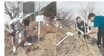
公園・学校など公共施設の緑化(笠岡市)