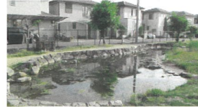
学校環境緑化(倉敷市 倉敷南小)