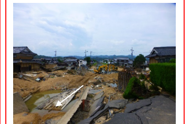
高梁川水系末政川 倉敷市 決壊：左岸L=150m ：右岸L=150m 浸水面積：約1,200ha 浸水戸数：約4,600戸