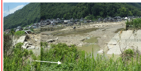
高梁川水系真谷川 倉敷市 決壊：左岸L=75m 浸水面積：約1,200ha 浸水戸数：約4,600戸