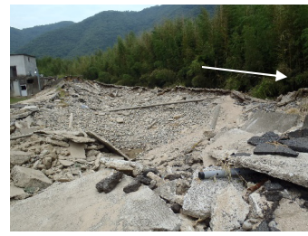
高梁川水系高梁川 総社市 決壊：右岸L=130m 浸水面積：約150ha 浸水戸数：約190戸