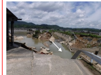
高梁川水系高馬川 倉敷市 決壊：左岸L=20m ：右岸L=55m 浸水面積：約1,200ha 浸水戸数：約4,600戸