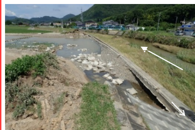
高梁川水系尾坂川 笠岡市 決壊：左岸L=80m 浸水面積：約200ha 浸水戸数：約140戸(調査中)