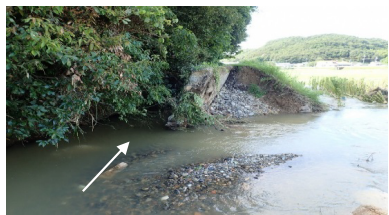
高梁川水系岩倉川 井原市 決壊：右岸L=15m 浸水面積：約8ha 浸水戸数：なし