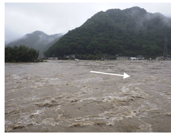
高梁川水系高梁川 高梁市 決壊：なし(越水のみ) 浸水面積：約10ha 浸水戸数：約80戸