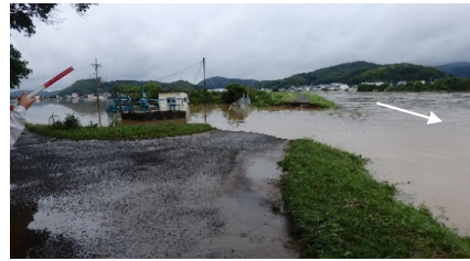
高梁川水系小田川 矢掛町 決壊：左岸L=130m ：右岸L=40m 浸水面積：約130ha 浸水戸数：約100戸