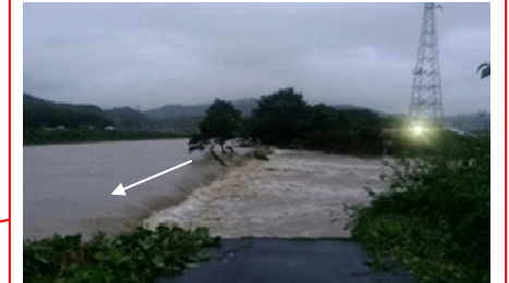
旭川水系砂川 岡山市 決壊：左岸L=120m 浸水面積：約750ha 浸水戸数：約2,200戸