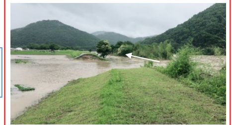
旭川水系旭川 岡山市(北区御津国ヶ原) 決壊：左岸L=50m 浸水面積：約85ha 浸水戸数：約80戸