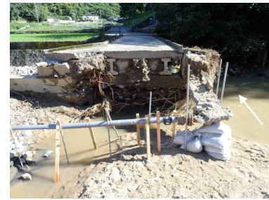
芦田川水系高屋川 井原市 決壊：左岸L=35m 浸水面積：約2ha 浸水戸数：なし