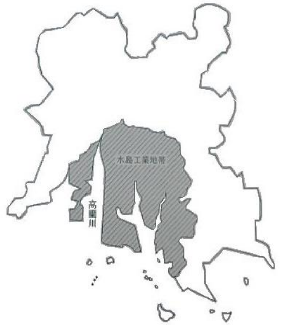
水島工業地帯の区域

水島海岸通1～5丁目、水島川崎通1丁目、水島中通1～4丁目、水島福崎町、水島西通1～2丁目、水島東千鳥町、水島西千鳥町、水島相生町、水島東常盤町、水島西常盤町、水島東栄町、水島西栄町、水島東弥生町、水島西弥生町、水島東寿町、水島西寿町、水島東川町、水島南緑町、水島北緑町、水島南瑞穂町、水島北瑞穂町、水島南春日町、水島北春日町、水島南幸町、水島北幸町、水島青葉町、水島高砂町、神田1～4丁目、水島明神町、水島南亀島町、水島北亀島町、福田町浦田、福田町福田、福田町古新田、北畝1～7丁目、中畝1～10丁目、福田町東塚、東塚1～7丁目、南畝1～7丁目、松江1～4丁目、潮通1～3丁目、福田町広江、広江1～8丁目、呼松町、呼松1～3丁目、連島町連島、連島町亀島新田、連島町西之浦、連島町鶴新田、連島町矢柄、鶴の浦1～3丁目、連島1～5丁目、連島中央1～5丁目、亀島1～2丁目、児島通生、児島塩生、児島宇野津、玉島乙島