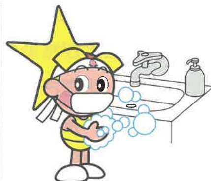
「岡山県マスコット ももっち」