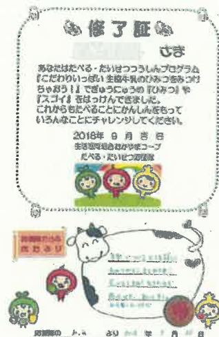
メッセージ入り修了証