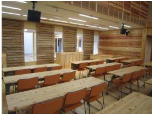
ホール前後からの状況