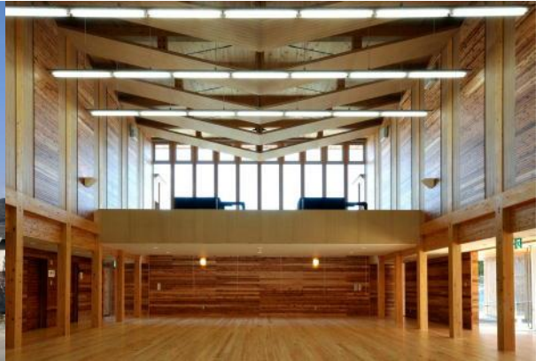
ホール内部（机、椅子を設置しない状態）