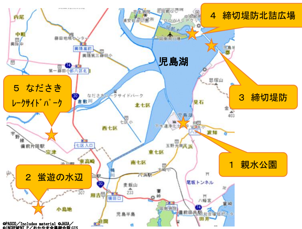
図1 調査場所位置図