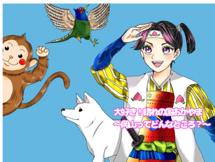
（山本 誉佳さんの作品）