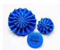
再生ブルーシートを使った 缶バッジ・コサージュ