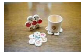
桧の節を使ったコースター