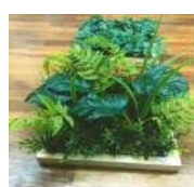
炭を使った脱臭剤 オーガニックカーボンボード