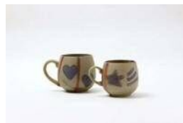
備前焼のリサイクルマグカップ