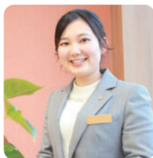
人間生活学部 2020年卒

A:一番大切にしていたのは「人間関係」 でした。インターンシップ先で、上司と 部下がフランクに話をしている…その ような会社であれば、長く働くことが できると思ったことが入社の決め手で す。