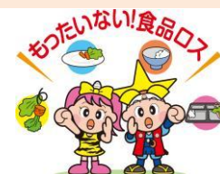
★「食品ロス」とは、まだ食べられるのに捨てられている食品のこと ©岡山県「ももっち」と「うらっち」