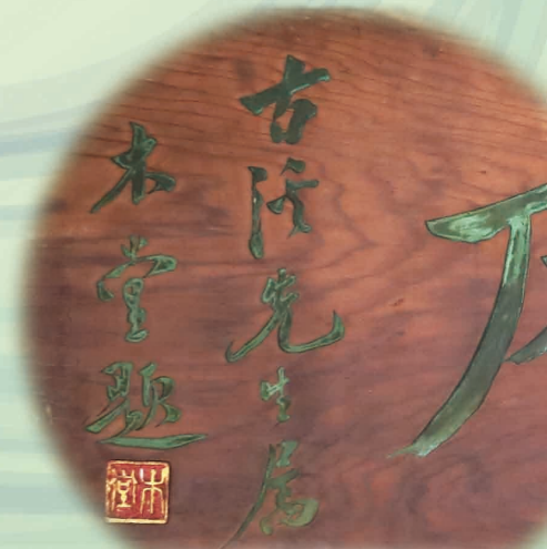
知人の庵に掲げられていた 木彫りの木堂書