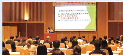
昨年のフォーラムの様子