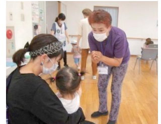
乳幼児健診での声かけの様子

子育て経験者をはじめとする身近な地域の人たちが、保護者等の子育てや家庭教育に関する相談にのったり、親子で参加する様々な取組や講座などの学習機会、地域の情報などを提供したりしています。