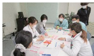
「ワーク・ライフ・バランス」をテーマとした企業での出前講座の様子

企業内の研修等に合わせて家庭教育に関する出前講座を、県が無料で実施しています。働いていても家庭教育について職場の人と考えるよい機会となっています。