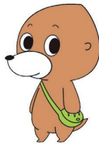
岡山県「ぱっちり!モグモグ」生活リズム向上マスコットキャラクター

学校や家庭、地域が協力して、子どもの生活習慣や学習習慣の定着を目指し、強化期間を設け、県表彰を行っています。早寝早起き朝ごはんや、ノーメディアデーなどの取組を実施しています。