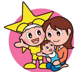
「ももっこステーション」シンボルマーク

乳幼児とその保護者が気兼ねなく訪れてくつろいだり、相互に交流したり、子育て相談ができる身近な場所で、県が認定した場所です。