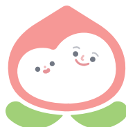
おかやま 子育て応援宣言企業

従業員の子育てや地域における子育てを応援するための具体的な取組を企業等に宣言してもらい、県が登録しています。