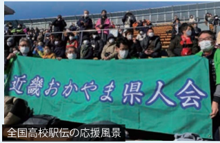
全国高校駅伝の応援風景

女子は、前年5位の「興譲館高校(24年連続24回目)」が出場。男子は、前年6位で全国最多出場の「倉敷高校(45年連続45回目)」が出場。女子は21.0975kmを5区間、男子は42.195kmを7区間でつなぎます。