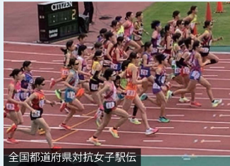
全国都道府県対抗女子駅伝

冬晴れの都大路を颯爽と駆け抜ける郷土の若人に声援を送るべく、近畿おかやま会、地元岡山の方々が、競技場に駆けつけ力走を後押ししました。