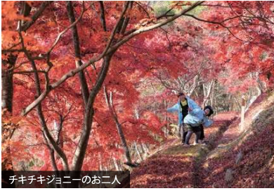
チキチキジョニーのお二人