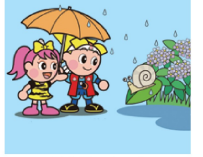
岡山県マスコット「うらちいももち」