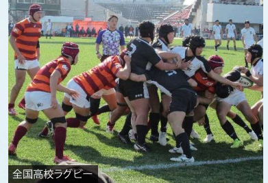
全国高校ラグビー