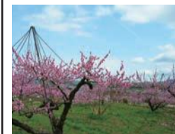
赤磐市鴨前の桃畑