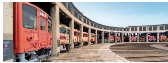
津山まなびの鉄道館

所在地: 津山市大谷 TEL: 0868-35-3343 FAX: 0868-35-3396 休館日: 毎週月曜日