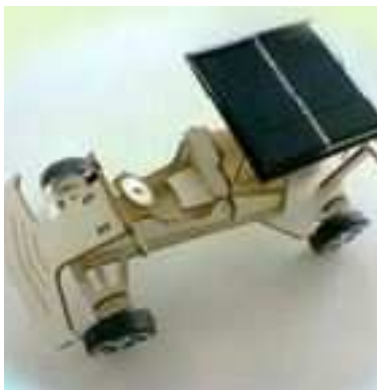
ミニ・ソーラーカー