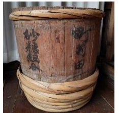
町苅田砂糖組合 砂糖樽 (赤磐市山陽郷土資料館蔵)

赤磐市内の事例 を中心に、幕末か ら昭和30年代ま でのさとうきびの 栽培・砂糖生産の 様子を紐解きます。