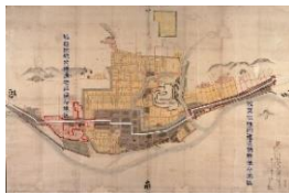
「津山城下町絵図(享保八年頃)」 に加筆

津山市にある城 東・城西両伝建 地区の歴史的背 景を理解する際 に、どのように資 料を活用したか を解説します。