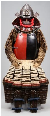
赤黒片身替白糸威二枚胴具足▶ (高梁市蔵)

所領が入り組み、領主の 移り変わりも激しかった 江戸時代の備中国を治 めた大名についてみてい きます。