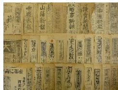
第二次世界大戦前に発行 された新聞

倉敷市立自然史 博物館所蔵の植 物標本から見つ かった歴史的に 貴重な新聞を紹 介し、その意義 を考えます。