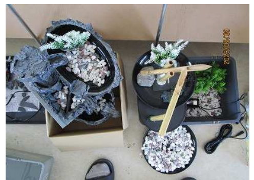
「和」のイメージで、コンパクトな ししおどしと滝をつくっています。