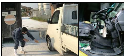
車両はタイヤだけでなく、 泥よけの内側まで消毒 し、 フロアマットの交換やペダル等車内も消毒