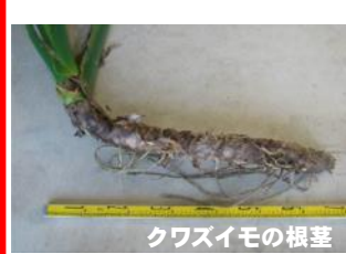
クワズイモの根茎