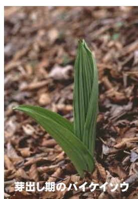
芽出し期のバイケイソウ