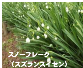
スノーフレーク (スズランスイセン)