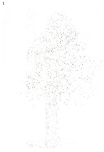
1. 畑山太志『生まれかわり』 素材：キャンバス、アクリル、サイズ：80.3×60.6cm、制作年：2020 2. Michail Michailov [dust to dust#91] 素材：color pencil on paper、サイズ：46×46cm、制作年：2020 3. Enzo Certa [Charles Quintの冠] 素材：石膏・木・銅・金箔・金箔、制作年：2020 4. Charlotte Vitaïoli [Voir les bateaux qui Chauvent] 素材：Painting on silk and wool、サイズ：280×240cm、制作年：2017 5. 架菜梨案『あなたと触れ合って広がる』 素材：キャンバス、油彩、色鉛筆、サイズ：130.3×130.3cm、制作年：2019