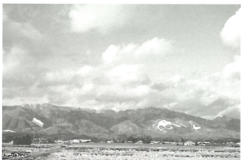
那岐山は水ノ山後山那岐山国定公園にも指定されている標高1,255mの中国山地の秀峰で、奈義町はその麓に広がる町です。今回の展覧会の会場の一つでもある奈義町現代美術館は那岐山を借景としており、展示室「大地」の中心軸は、那岐山の山頂に向かっています。奈義町のシンボルである那岐山のある風景と外部からのアーティストの視点が変わることによって新たな「場所の特性」が表出します。

奈義町は岡山県北部に位置し、人口6000人程度の小さな町です。町内には磯崎新、荒川修作、マドリン・ギンズ、岡崎和郎、宮脇愛子らの建築家と美術家が共同で建築した第3世代美術館の奈義町現代美術館を有します。奈義町の所在する岡山県は3年に1度開催される瀬戸内内芸術祭の会場でもあり多くの美術ファンが訪れます。地方だからこそできる文化発信、またアーティストにより運営、企画される本展示ならではの視点をお楽しみください。