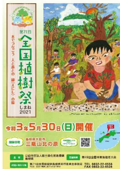
第71回全国植樹祭大会ポスター