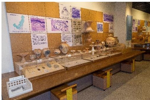
鏡野町郷土博物館（鏡野町）