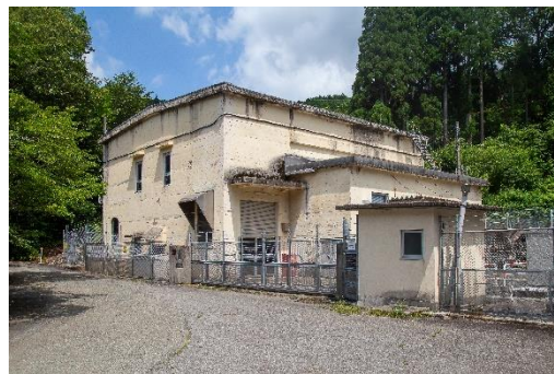
上斎原発電所（鏡野町）