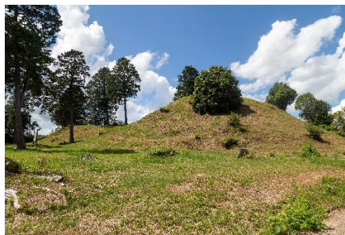
美和山古墳群（津山市）