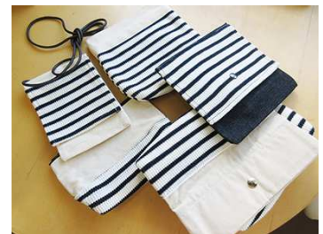
SDGs 企業からの端材を利用したポーチ