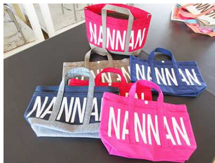
デニム・帆布の「NANNAN バッグ」