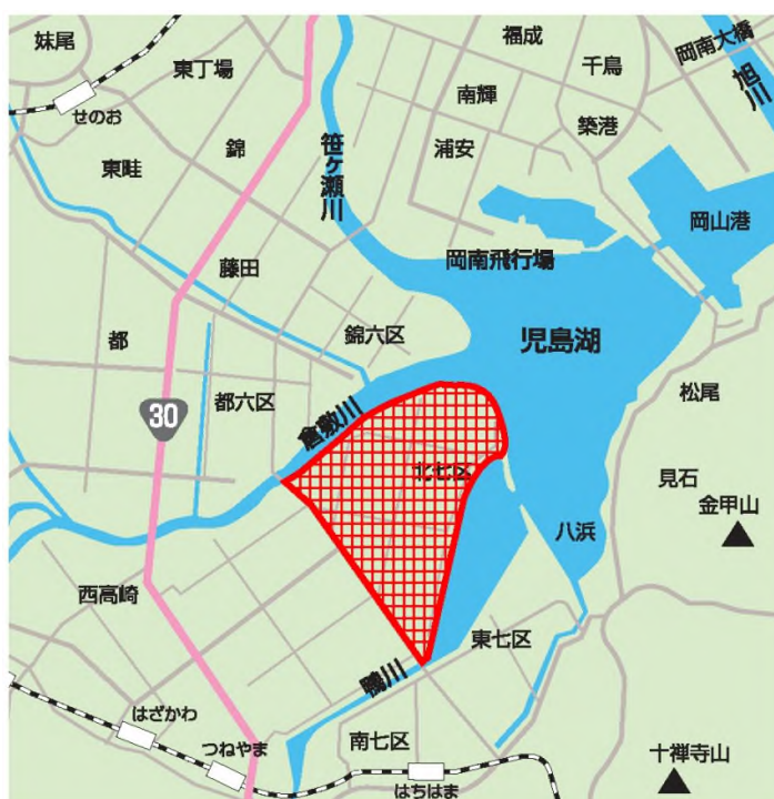
流出水対策地区（岡山市南区北七区）