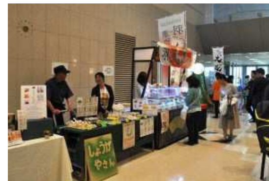
農林水産関係 出展ブース