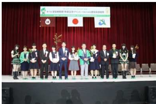
代表者記念植樹の苗木を 高校生にお渡し