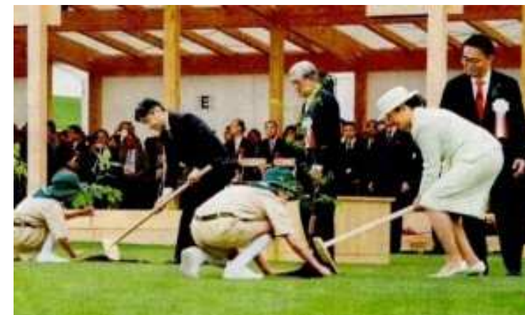
天皇皇后両陛下によるお手植え