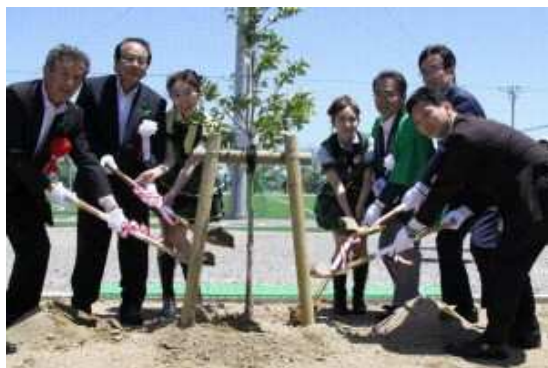
主催、来賓、出演者等による記念植樹