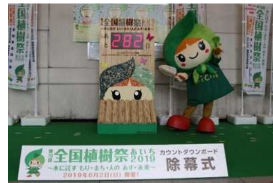
カウントダウンボード