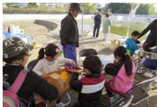
才兼池公園植樹祭