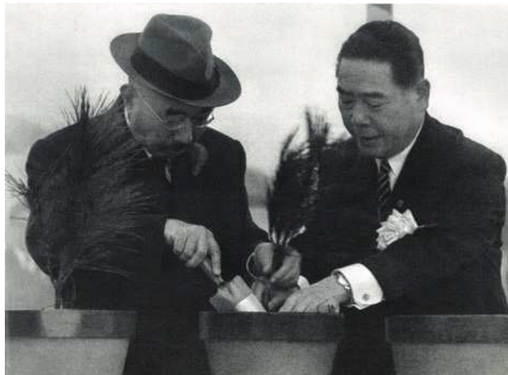
金山にてアカマツをお手植えされる 天皇陛下