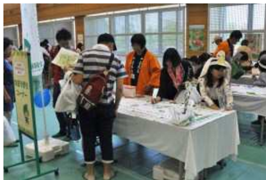
全国植樹祭に向けた 応援のぼり作り