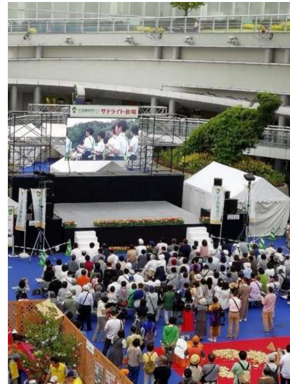
オアシス21(名古屋市)