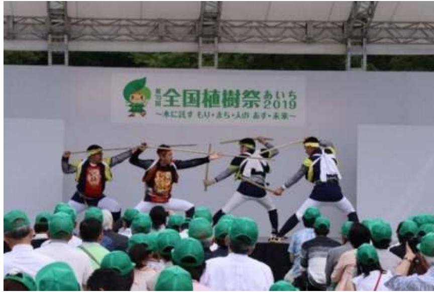
おもてなしステージ