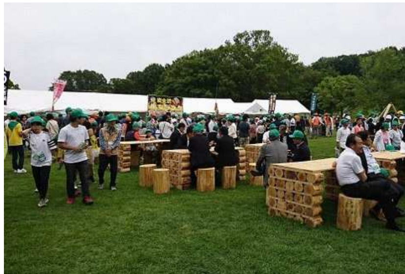
おもてなし広場の様子