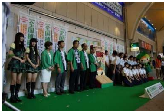
カウントダウンボードの お披露目