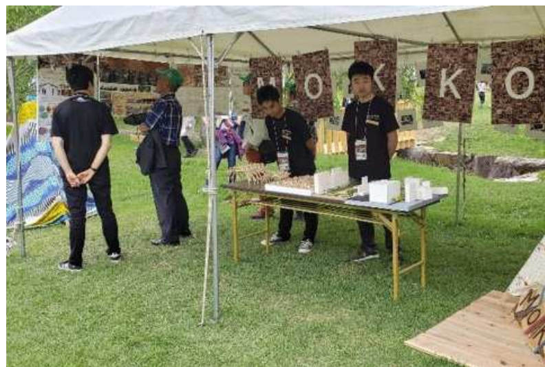
各種展示コーナー