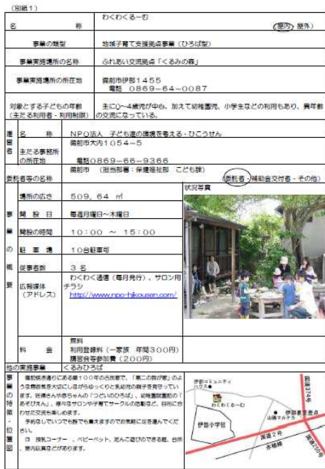
県HPの掲載イメージ

県が認定場所には、「ももっち」をあしらった統一シンボルマークの看板やのぼりなどの宣伝資材を配布し、掲示していただいています。