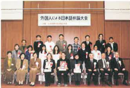
第16回 外国人による 日本語弁論大会 (1999.11.28)