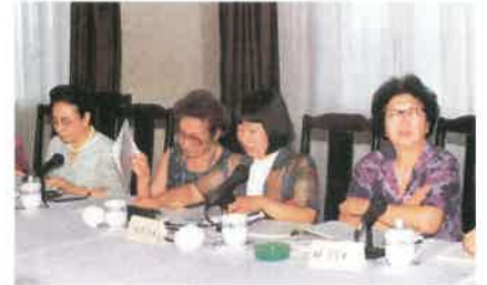
日中女性友好交流シンポジウム(北京)

岡山県内の日中友好を願う各界・各分野の女性が、「日中共同声明」および「日中平和友好条約」を基礎とし、思想・信条・政党・政派の違いをこえて、子々孫々・未来永遠にわたる