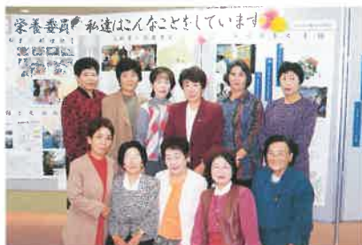
ウイズフェスティバル活動紹介パネル前にて

誰もがいきいきと自己実現できる社会をつくるための基本は、まず健康であること。私達栄養委員8,227人は、これからも食卓から活力ある地域づくりを進めていきます。