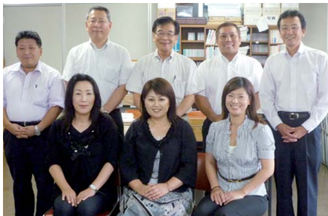
お集まりいただいた方々

働く女性の増加とともに女性が働き続けやすい環境を整える企業も増えてきました。社員を経営者の最も頼りになるパートナーと考え、ともに育ち合い、活力ある豊かな人間集団としての企業づくりに取り組んでいる岡山県中小企業家同友会のみなさんに、女性の力をどうとらえ、それを活かすためにどのように取り組んでいるかをお聞きしました。