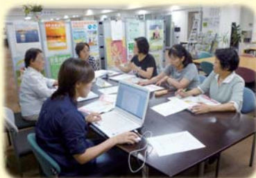
セミナー開催に向け活発に議論中

平成24年2月25日(土)～26日(日)、岡山プラザホテルで開催する「第20回助産師のための母乳育児セミナー」の準備のために集まりました。