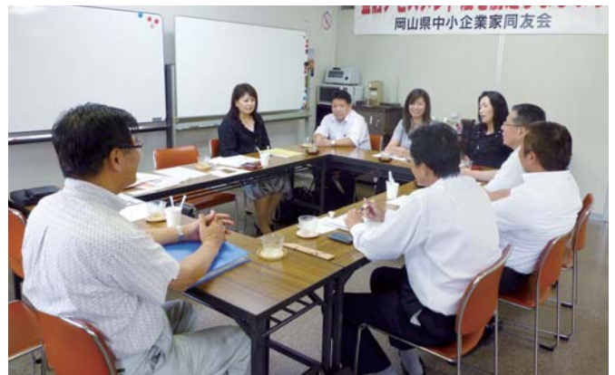
女性の活用について、熱く語り合うみなさん

【山口】 どこへ就職するかではなく、どう生きるかを考えた時、具体的に働き方というものが見えてくるのかもしれないですね。