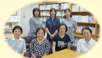
多忙な仕事の合間をぬって集まったメンバーさん

登録団体なので、メールボックスを利用できる点、いろんな情報を得ることができる点も魅力ですね。