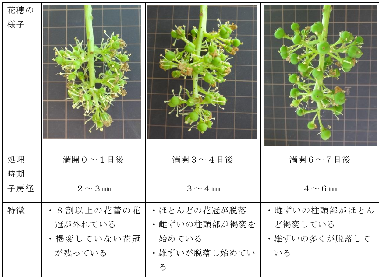
図1 「ピオーネ」の満開期一回処理における処理時期ごとの花穂の外観

y Tukey-Kramer法（無核化率はアークサイン変換後）により、**は1%水準で同列内の異符号間に有意差あり、nsは5%水準で有意差なし