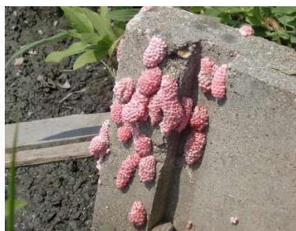
用水路（水口）の卵塊