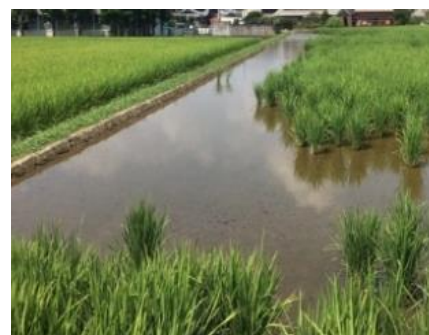
食害を受けやすい 入水口・排水口や周縁部（畦際付近）