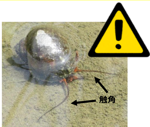
ジャンボタニシ（スクミリングガイ）