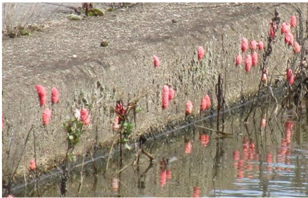
図1 用水路壁に産みつけられたジャンボタニシの卵塊(7月の状況)

ジャンボタニシによるイネの食害は移植直後の3～4葉期の柔らかい葉で起こりやすく、移植直後から3週間頃までの被害を抑えることが重要となります。今後、県中南部では、本格的な田植え時期を迎えますので、厳寒期の対策を行っている場合でも十分な対策を取ってください。