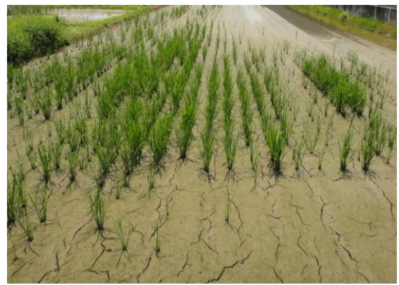
図2 ジャンボタニシによる食害があった圃場