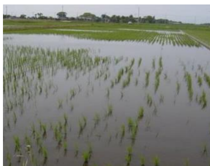
移植直後に食害を受けた移植苗