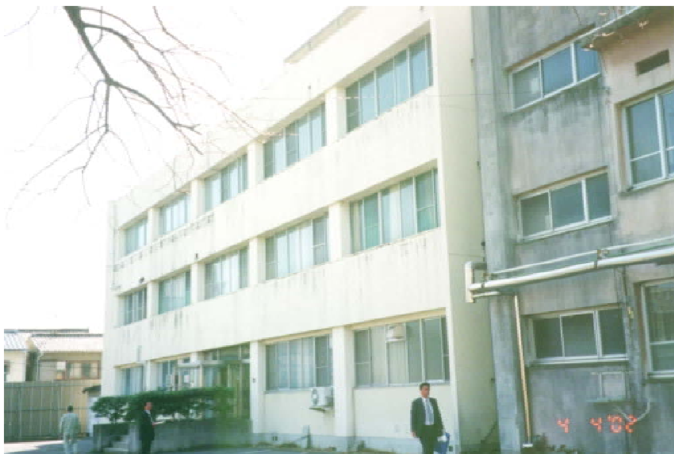
旧岡山国立病院外観 (小児病棟)