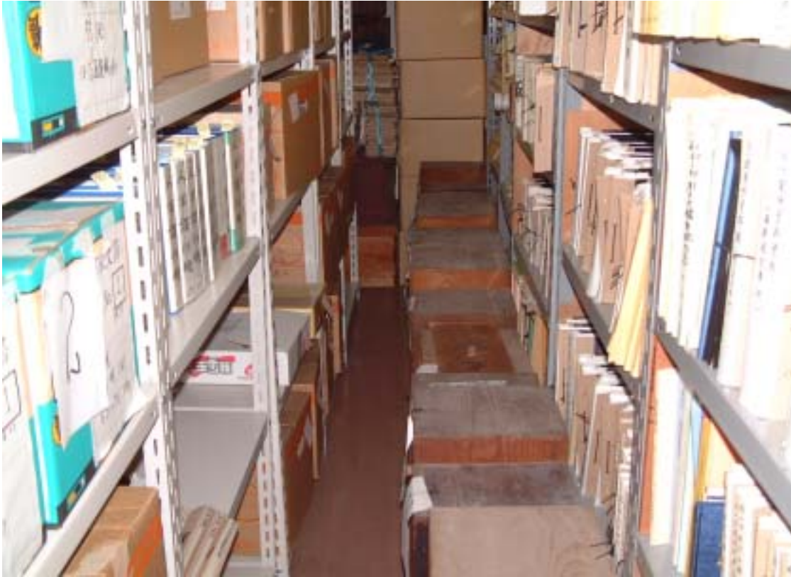
古文書の収蔵状況