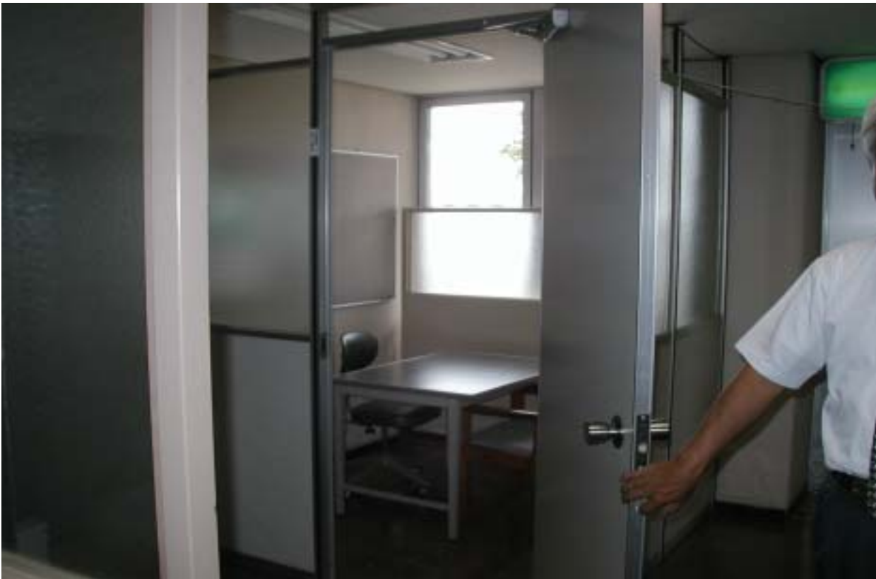
中央児童相談所相談室