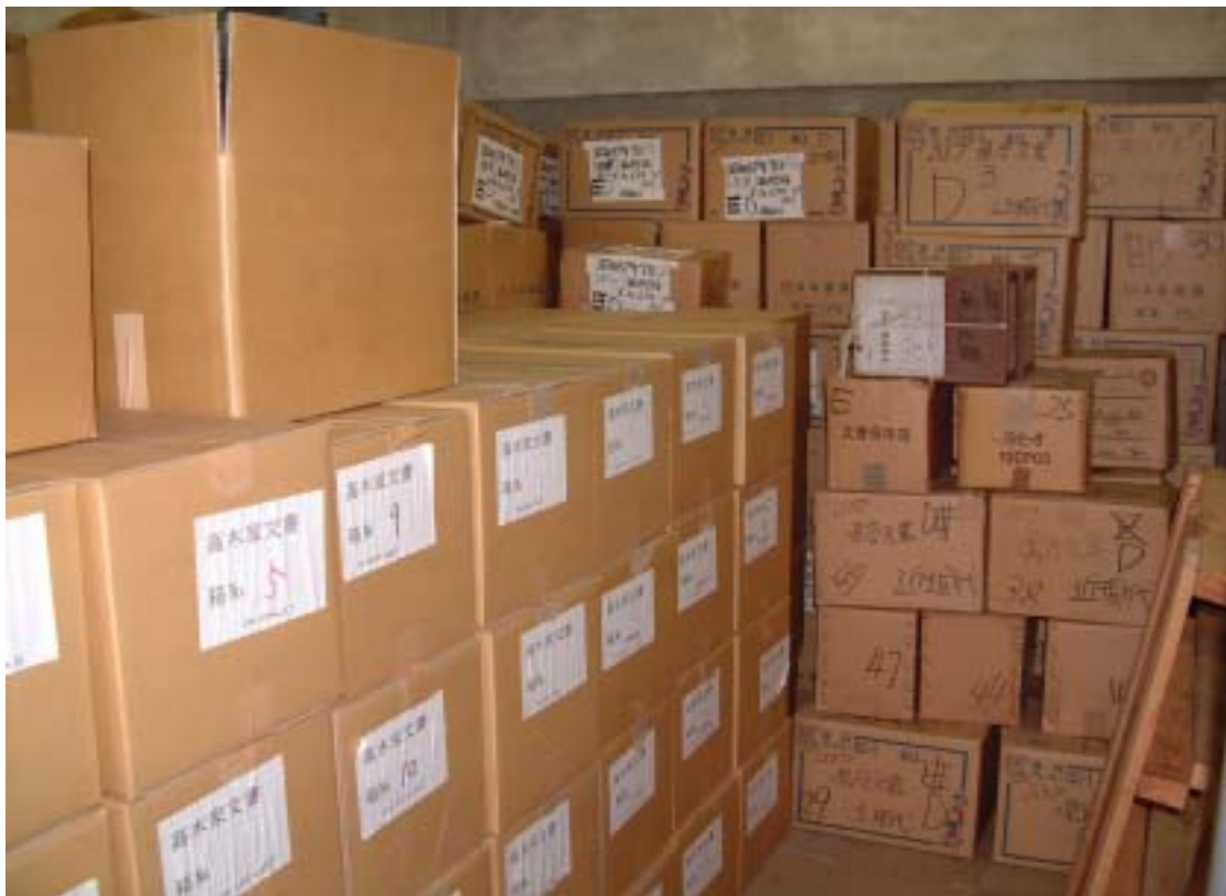
古文書・公文書の箱詰