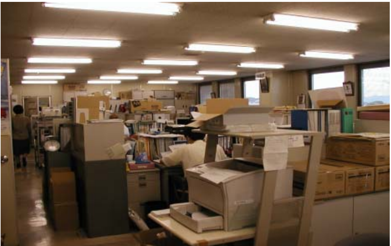
岡山県社会福祉協議会事務室