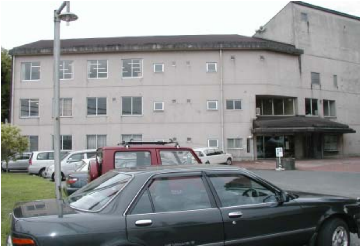
中央児童相談所、女性相談所、身体・知の更生相談所外観