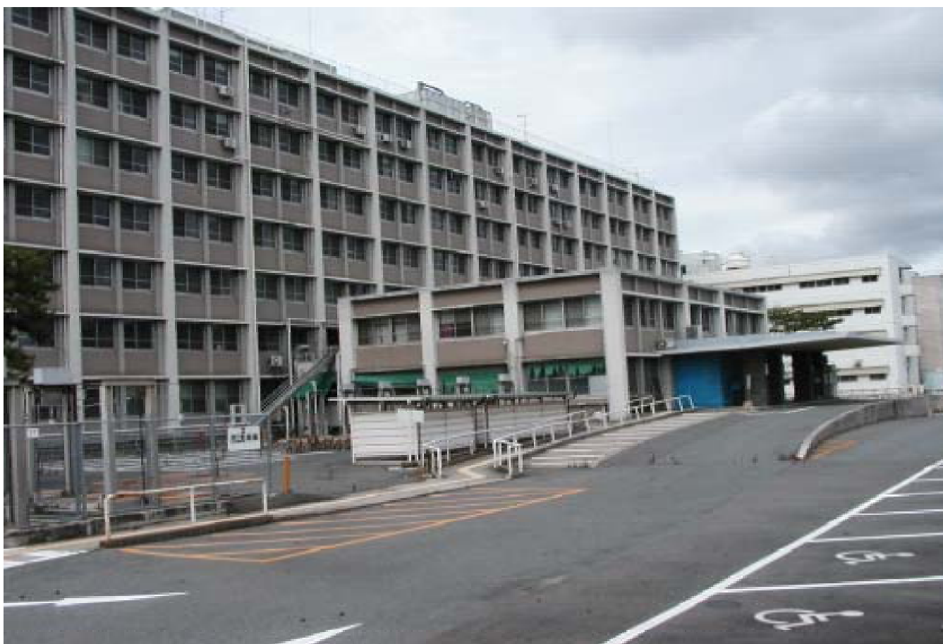
旧岡山国立病院外観 (本館・循環器病センター)