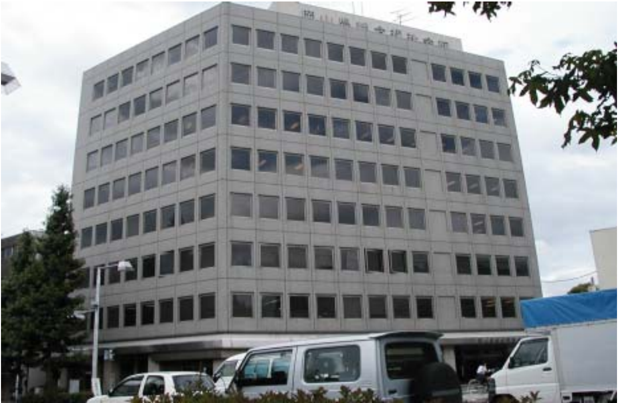
現総合福祉会館外観