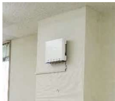
壁に設置した場合