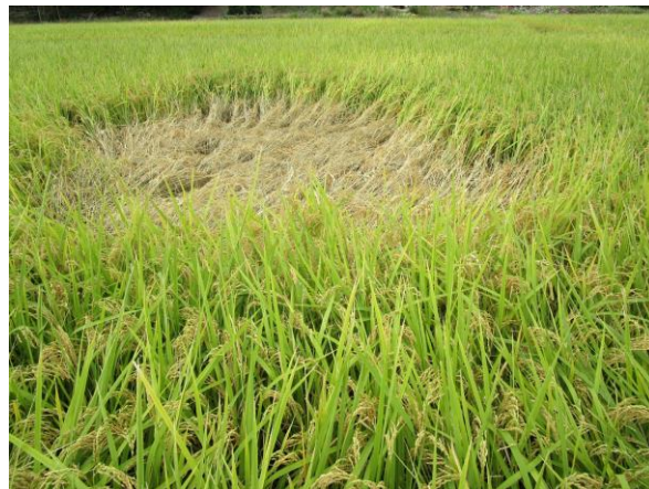
圃場の被害（坪枯れ）