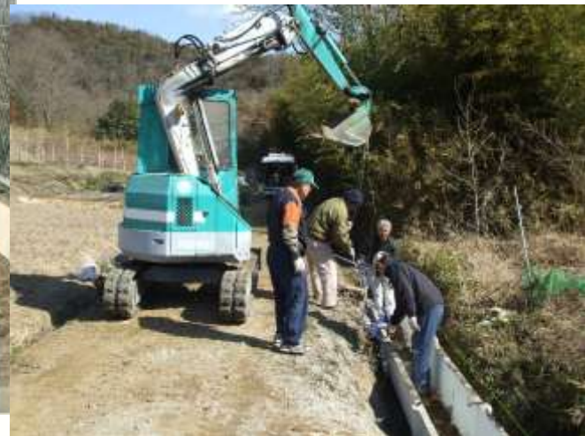
土水路からコンクリート水路への更新