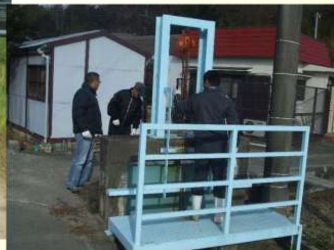
ゲートの保守管理（点検・注油）