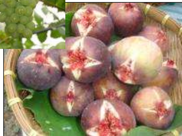
備前市の特産品(イチジク)