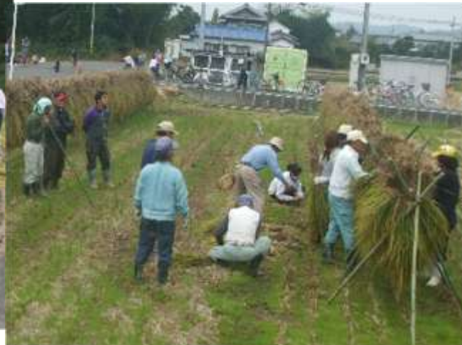
収穫米を総出で天日干し（はぜ掛け）