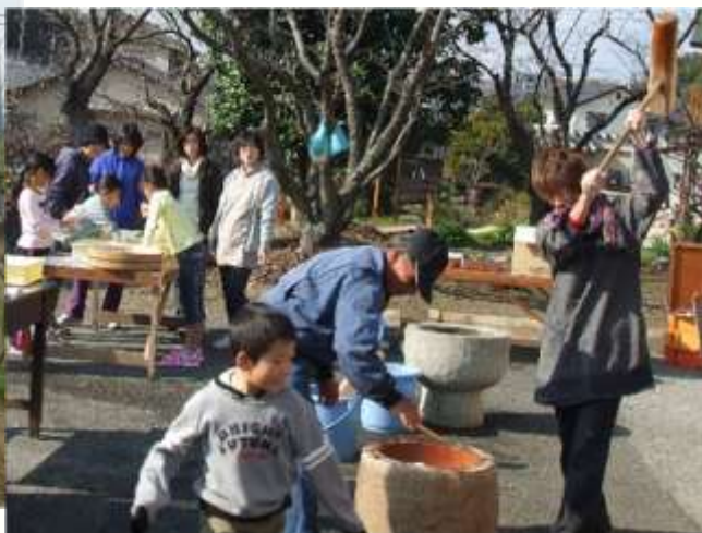
地域内外の住民の方との餅つき（収穫祭）