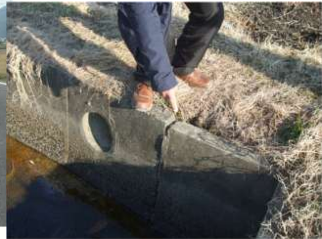
水路の機能診断（破損個所の早期発見）