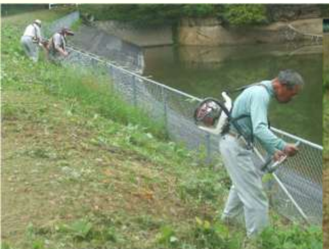
ため池の草刈りと併せて施設点検