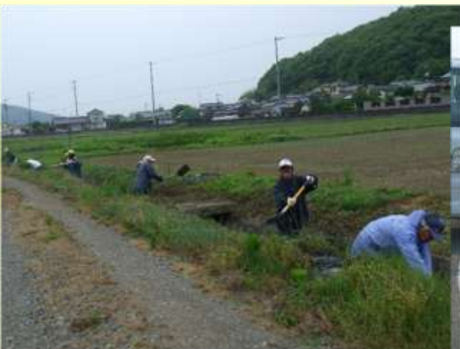
地域ぐるみでの水路の泥上げ