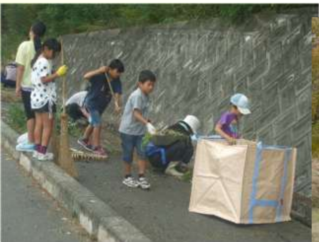
環境・景観保全のための清掃活動