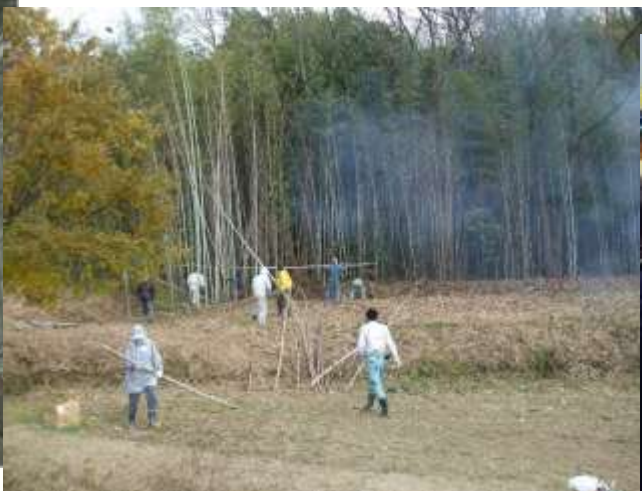
遊休農地発生防止のため、竹やぶの伐採