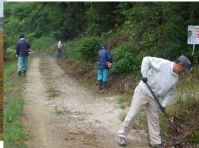
地域ぐるみでの農道の草刈り