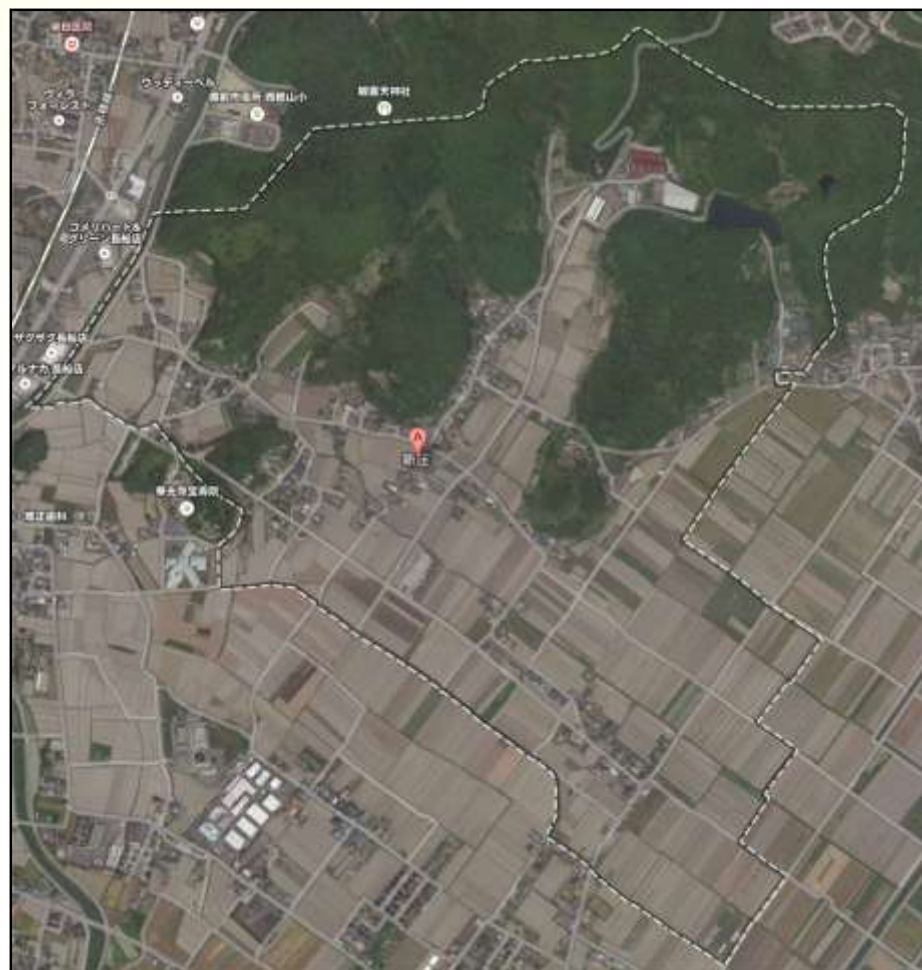
新庄地区の航空写真（条里制による整然とした水田）