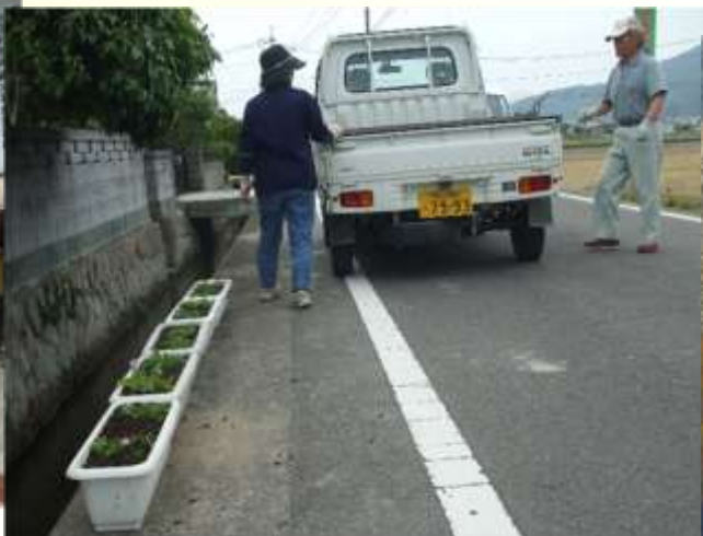
用水路等へプランターを配置し、農村美化