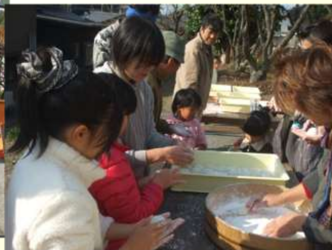
3世代総出で餅づくりの継承