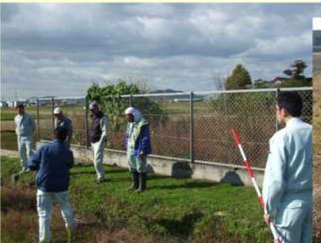
熟練者達との連携による的確な機能診断