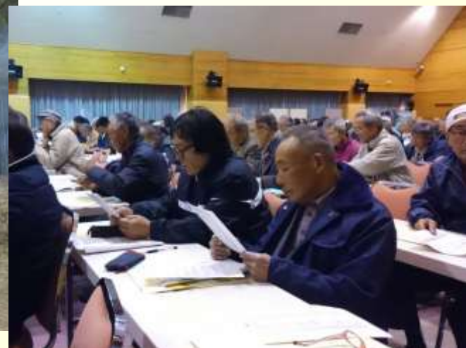
事務・技術研修会への参加