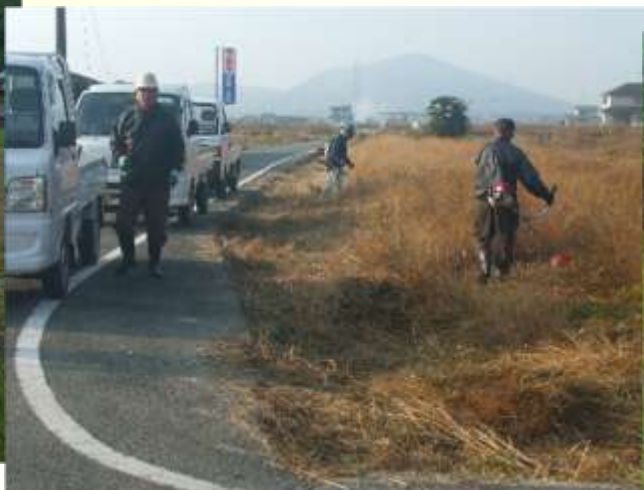
本組織が管理する遊休農用地の保全