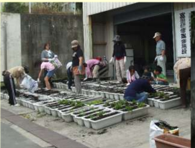
地域ぐるみでプランターへの花の植栽