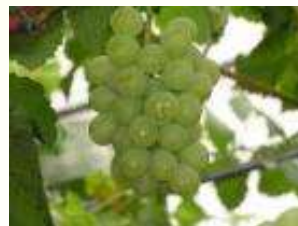
ぶどう(瀬戸ジャイアンツ)