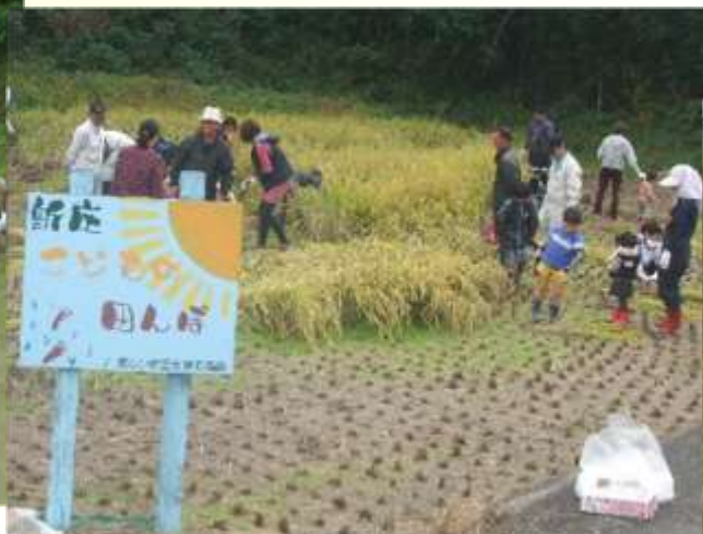
遊休農地を活用した「こどもの田んぼ」