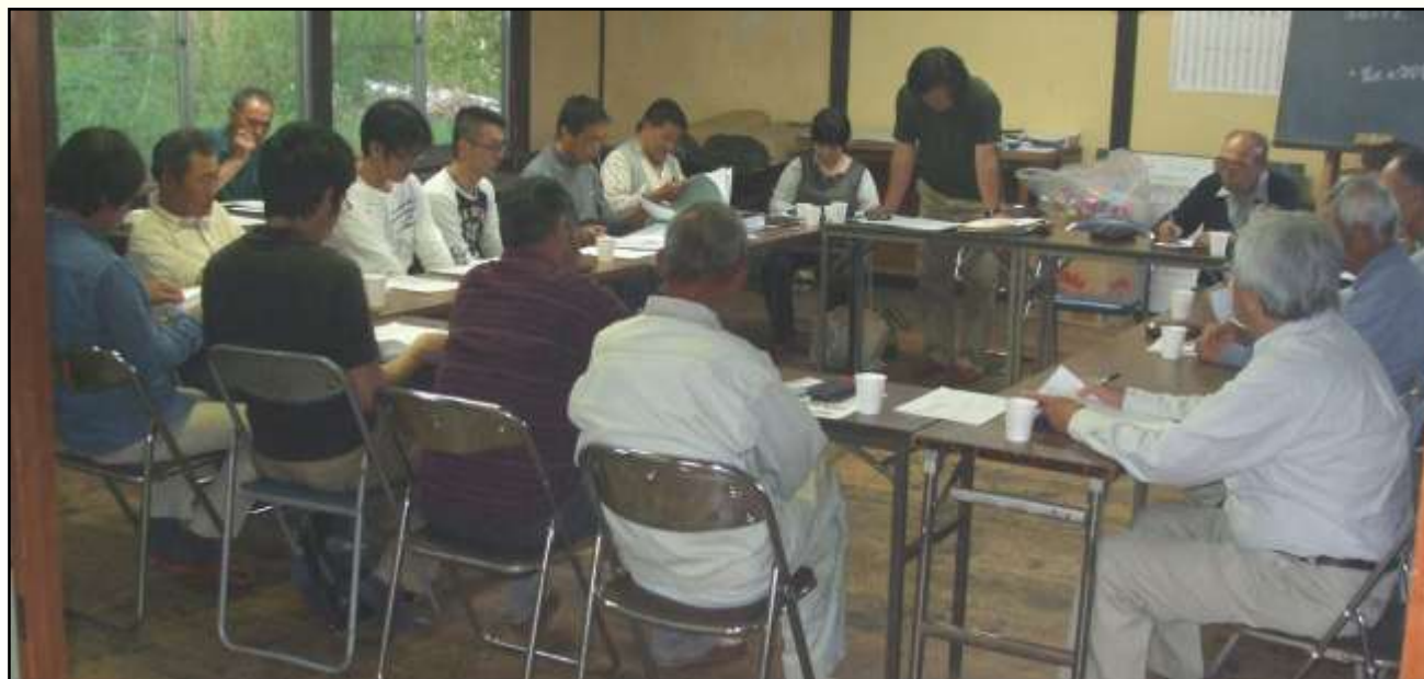
「美しい新庄を育てる会」の総会（地域の総意を図る重要な会議）