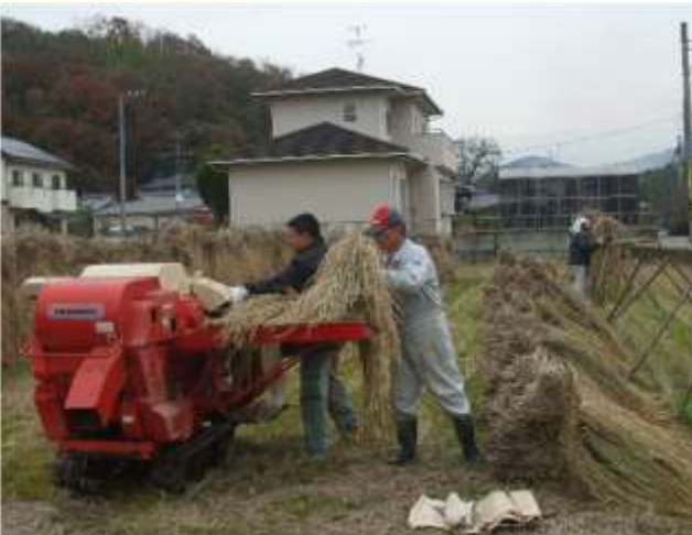
農法の継承（2世代で連携した脱穀作業）