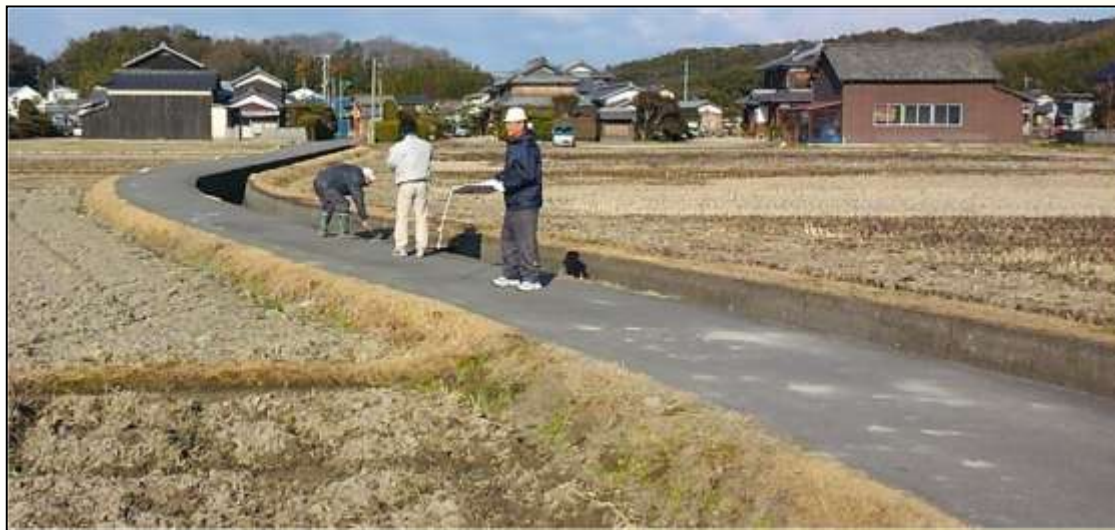
長寿命化活動で整備した農道舗装（砂利道からコンクリート舗装に）