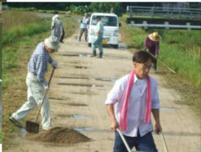
農道の保安全管理（路面への砂利補充）