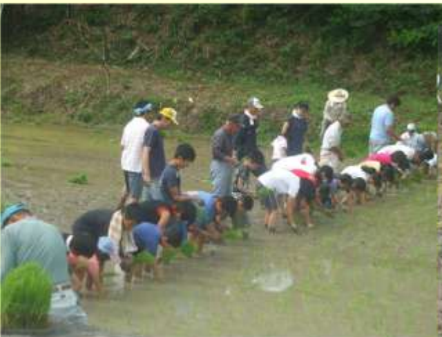
子供達への伝統農法の継承（手植え）