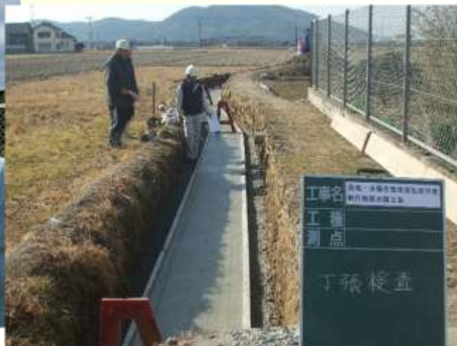
老朽化した水路の更新、農道路肩の補修