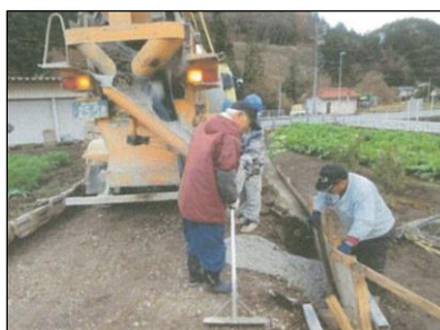
うしお 潮環境保全会 (新見市) 農道のコンクリート舗装