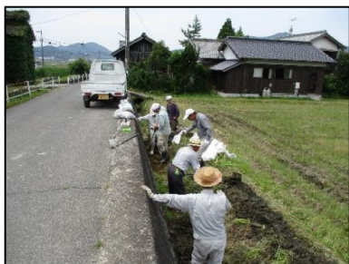
いいあらいけ 飯井荒池環境保全会 (瀬戸内市) 水路の泥上げ