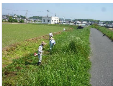
倉敷地域資源広域保全会 (倉敷市) 農道法面の草刈り