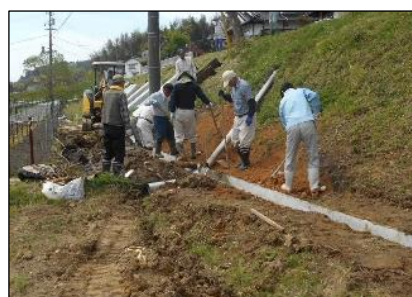
田中組織 (吉備中央町) 水路の更新