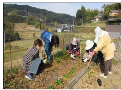
はが 珙和地区保全組合 (美咲町) 植栽活動 [景観形成]