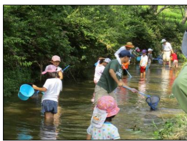
いけがはら 池ヶ原地域資源保全会 (津山市) 生物の生息状況の把握 [生態系保全]