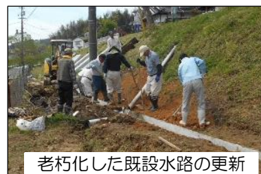
老朽化した既設水路の更新

活動計画書に位置付けた「交付対象面積」により交付額を算定 [ 負担割合： 国 1/2、県 1/4、市町村 1/4 ]