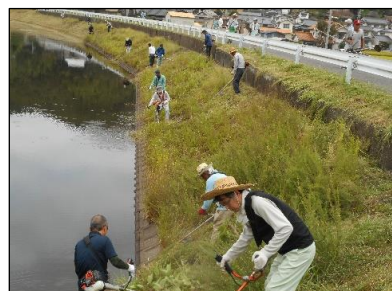
北川環境保全協議会 (笠岡市) ため池堤体の草刈り