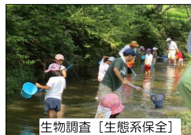
生物調査【生態系保全】