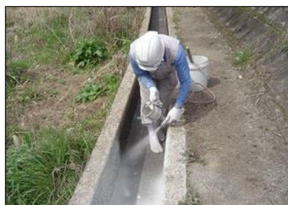
ふくいたのくま 福井・田熊地域環境保全組合 (津山市) 老朽化した水路の補修