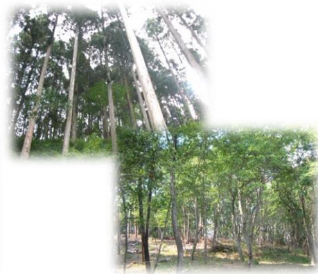
手入れが行き届いた森林