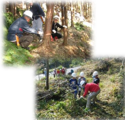
県・市町村・森林ボランティア 団体等による森林保全活動