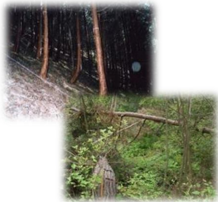
手入れが不足した森林

森林の重要性を県民の方々に普及啓発するとともに、県民各層が気軽に自主的かつ積極的に森林活動へ参加できるよう活動情報や場所の提供、技術指導など県民の社会貢献活動を支援することを目的としています。