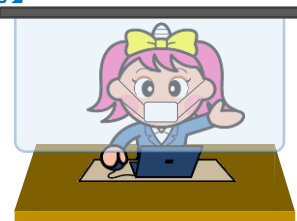
[インフォメーション]