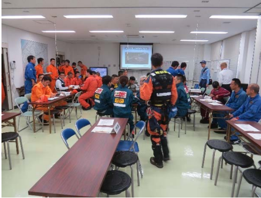
広島県総合防災訓練