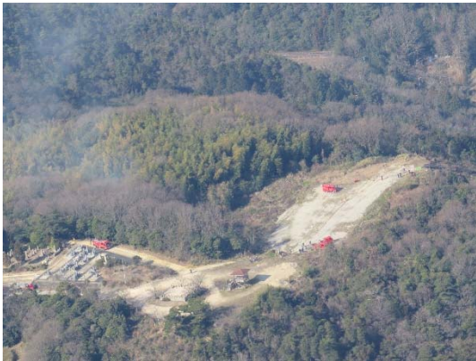
瀬戸内市林野火災合同訓練