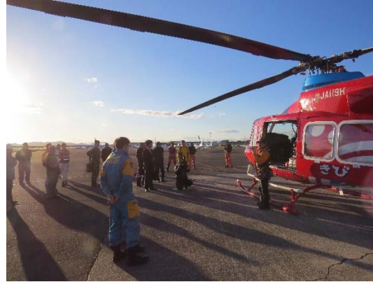
岡山県航空運用調整グループ連携訓練