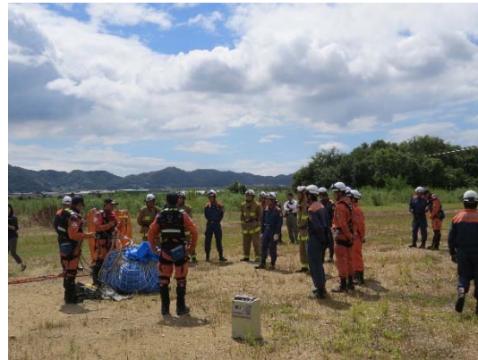
笠岡地区消防組合消防本部連携訓練