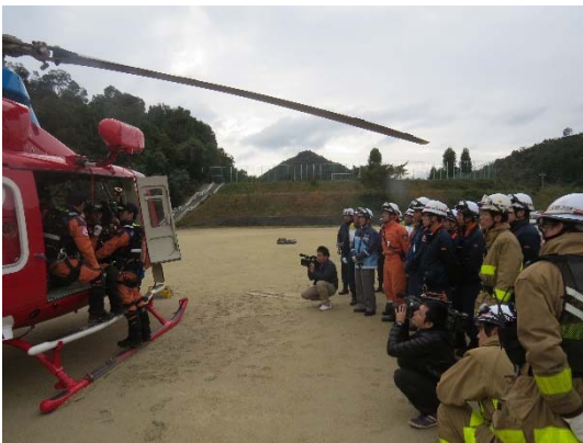
玉野市消防本部連携訓練