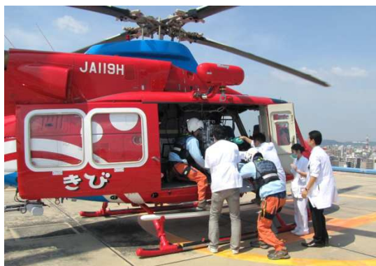
岡山市～高知県 転院搬送(平成24年6月5日)