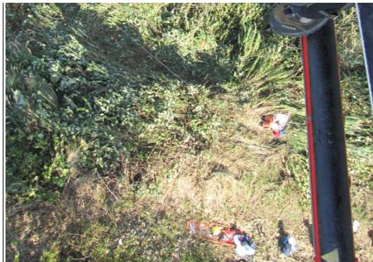
真庭市豊栄 山岳救助(平成24年10月20日)