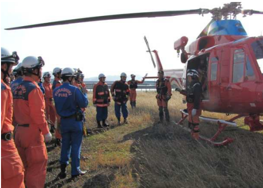
倉敷市消防局との連携訓練