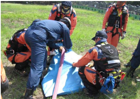
総社市消防本部との連携訓練