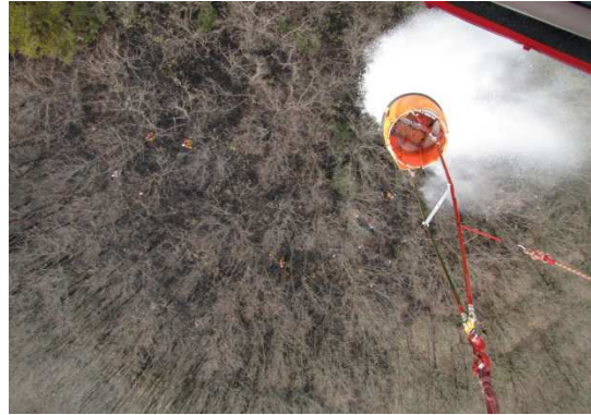
津山市加茂町 林野火災(平成25年3月7日)