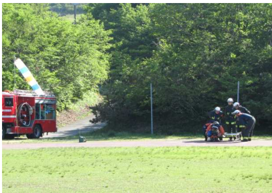
鳥取県西伯郡大山町 搜索活動(平成24年5月18日)