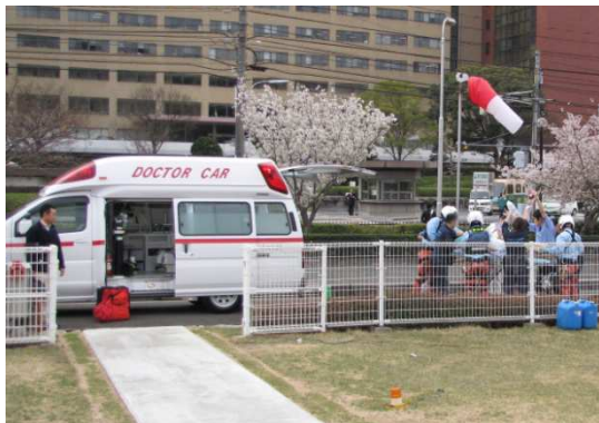
倉敷市～広島県 転院搬送(平成24年4月14日)