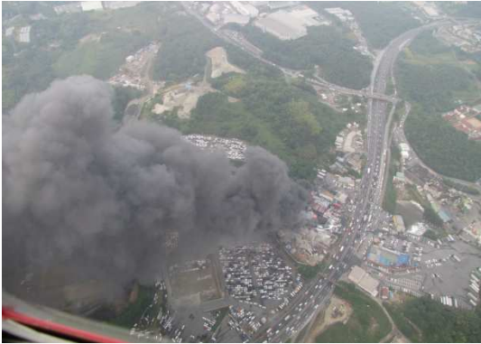
岡山市南区箕島 林野火災(平成24年5月29日)