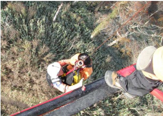
真庭市蒜山富山根 山岳救助(平成24年11月4日)