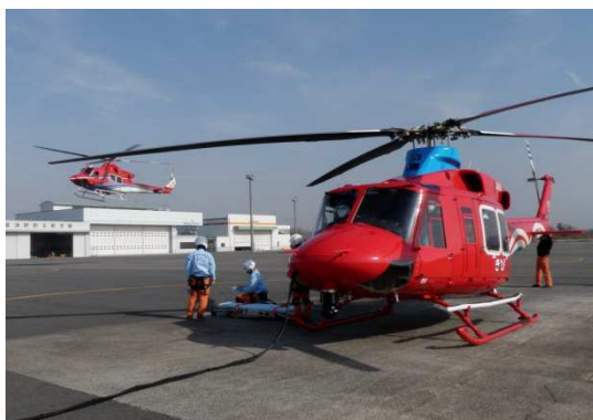
岡山市～山口県 転院搬送(平成24年11月28日)