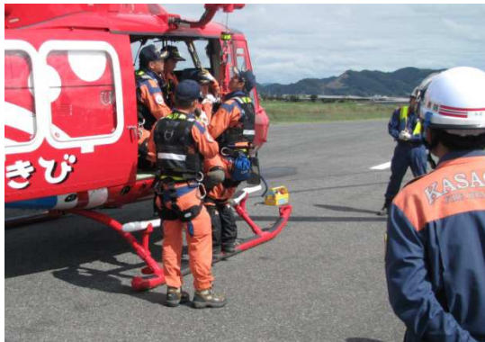
笠岡地区消防組合との連携訓練