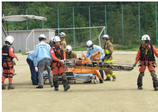
玉野市田井 救急搬送(平成24年5月17日)