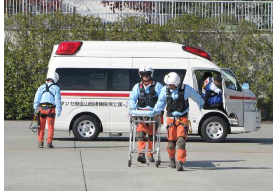
中四国DMAT救急搬送訓練