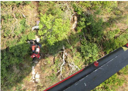
鳥取県佐伯郡大山町 山岳救助(平成24年5月16日)