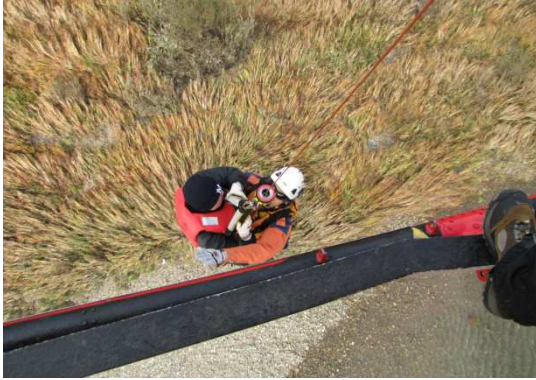
赤磐市総合防災訓練